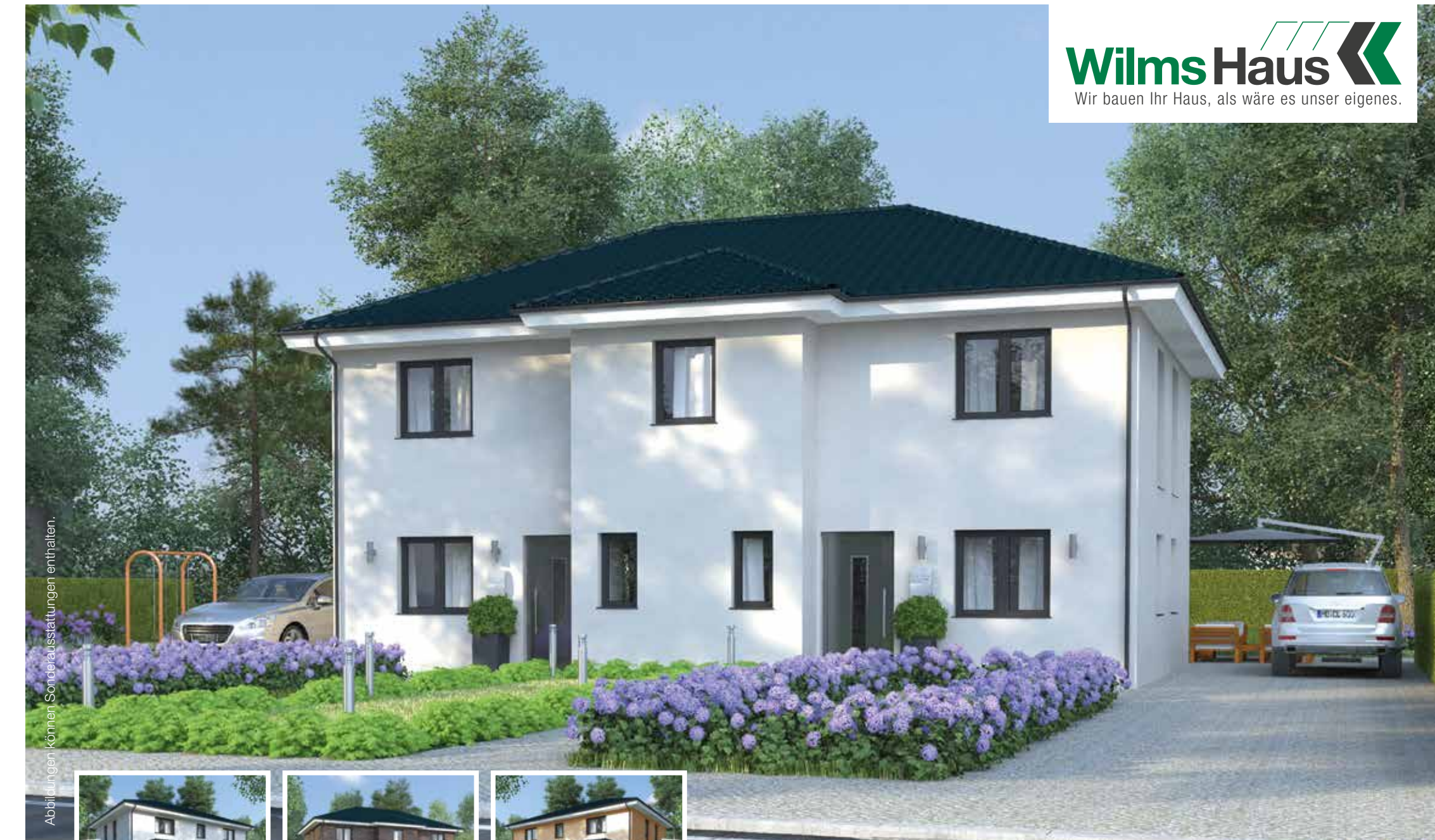
Abbildungen können Sonderausstattungen enthalten.